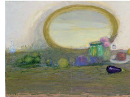
Fruits et miroir - 2015 - huile sur toile - collection particulière

« Fruits et miroir » Regarde bien ces deux tableaux.