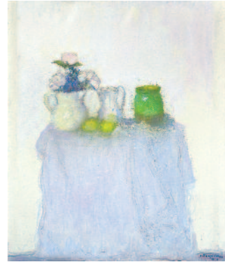
Trois pots, citron, nappe grise sur fond blanc - 2014 huile sur toile - Collection particulière

Cette salle regroupe des « natures mortes » : une nature morte est une peinture représentant des objets inanimés comme des fruits, des fleurs, des plats. Jacques Truphémus explique qu'il aime « laisser mûrir la toile ». Comme un fruit qu'on laisse mûrir, le peintre revient parfois sur une toile des années après l'avoir commencée.