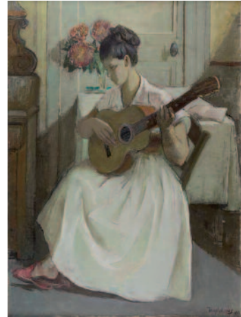
Aimée à la guitare - 1951 - huile sur toile - collection particulière