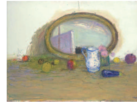
Fruits et miroir - 2016 - huile sur toile - Galerie Claude Bernard

Note les différences que tu remarques entre ces tableaux :