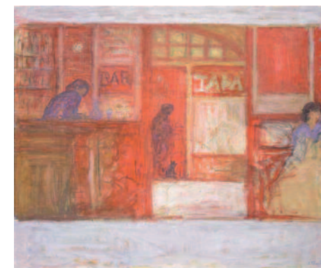
Bar tabac, harmonie de rouge - 1999- huile sur toile - Galerie Claude Bernard

L'artiste aime à rappeler que le quotidien apporte « un enrichissement » important. En se posant en spectateur, le peintre entre malgré lui dans l'intimité des personnages qui habitent ses toiles. Ici, les couleurs pastel, que le peintre utilise habituellement, laissent parfois la place à des couleurs plus vives : on y ressentirait presque le mouvement et le bruit de la ville, son agitation.