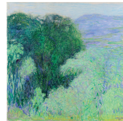
Terrasse à Cauvalat - 2006 - huile sur toile - collection particulière

Pendant une vingtaine d'années, Jacques Truphémus aimait passer ses étés dans les Cévennes, où il possède une maison familiale.