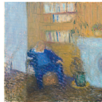
Autoportrait - 2005 - huile sur toile - Collection particulière

On appelle un « autoportrait », un portrait de l'artiste réalisé par lui-même. De nombreux artistes se sont représentés de cette manière, souvent en se positionnant devant un miroir ou, pour les peintres plus contemporains, d'après une photographie.