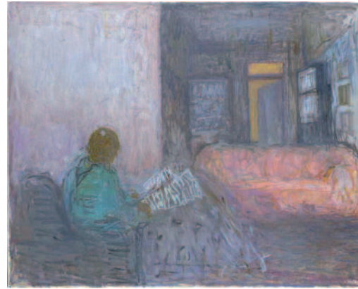
Aimée lisant au Vigon - 2009 - huile sur toile - collection particulière

58 années séparent ces deux toiles. Le style et la peinture de Jacques Truphémus ont évolué au fil du temps. C'est le cas de la plupart des peintres.